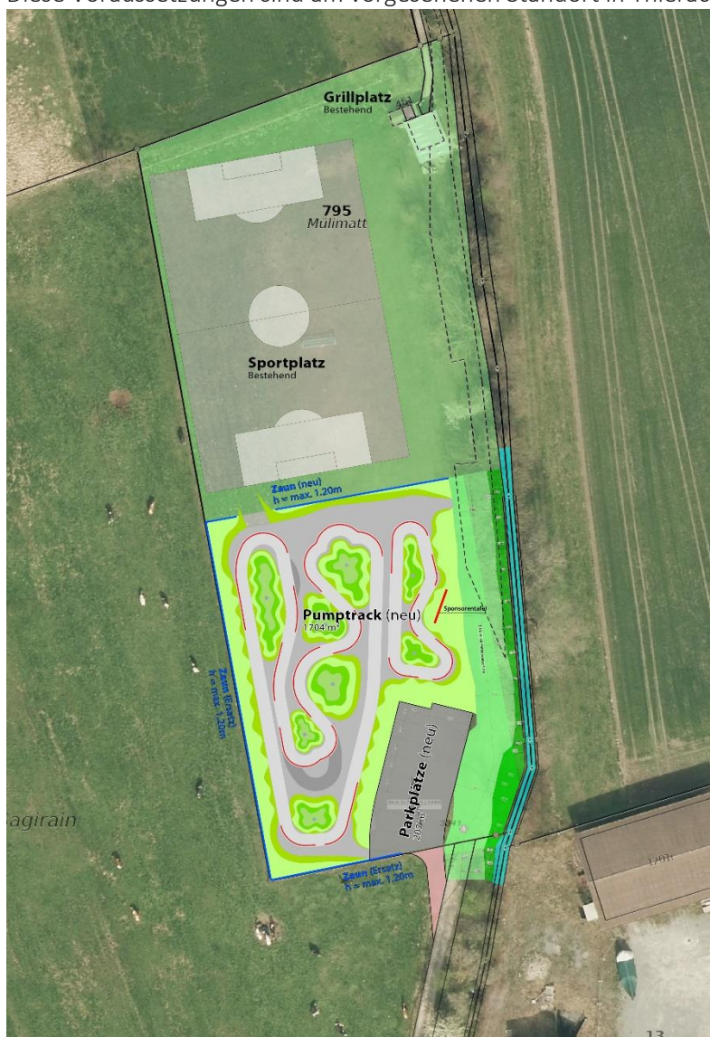
Orthophoto der Sport- und Freizeitzone "Mülilmatt" mit Projekt Pumptrack

Diese Voraussetzungen sind am vorgesehenen Standort in Thierachern in optimaler Weise vorhanden!